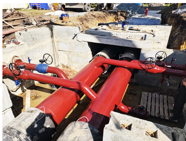
Рис. 2. «Курс-Антикор», Тепловая сеть